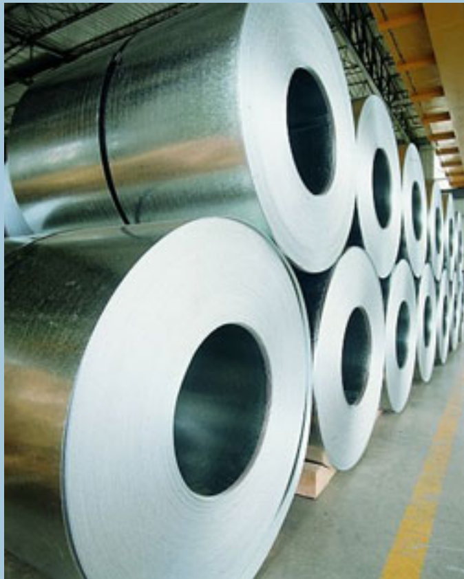
ПОЦИНОВАНА ЛАМАРИНА НА РУЛА GALVANIZED CIOLS